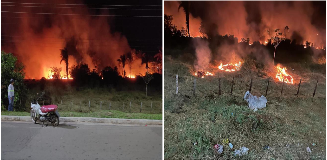
Figura 7: Fiscalização e Resgate Animal