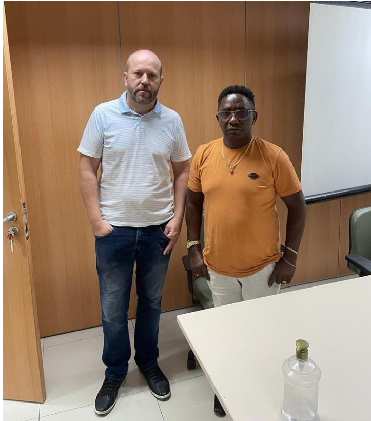
Figura 11: Reunião no Comando Geral do Corpo de Bombeiros do Maranhão