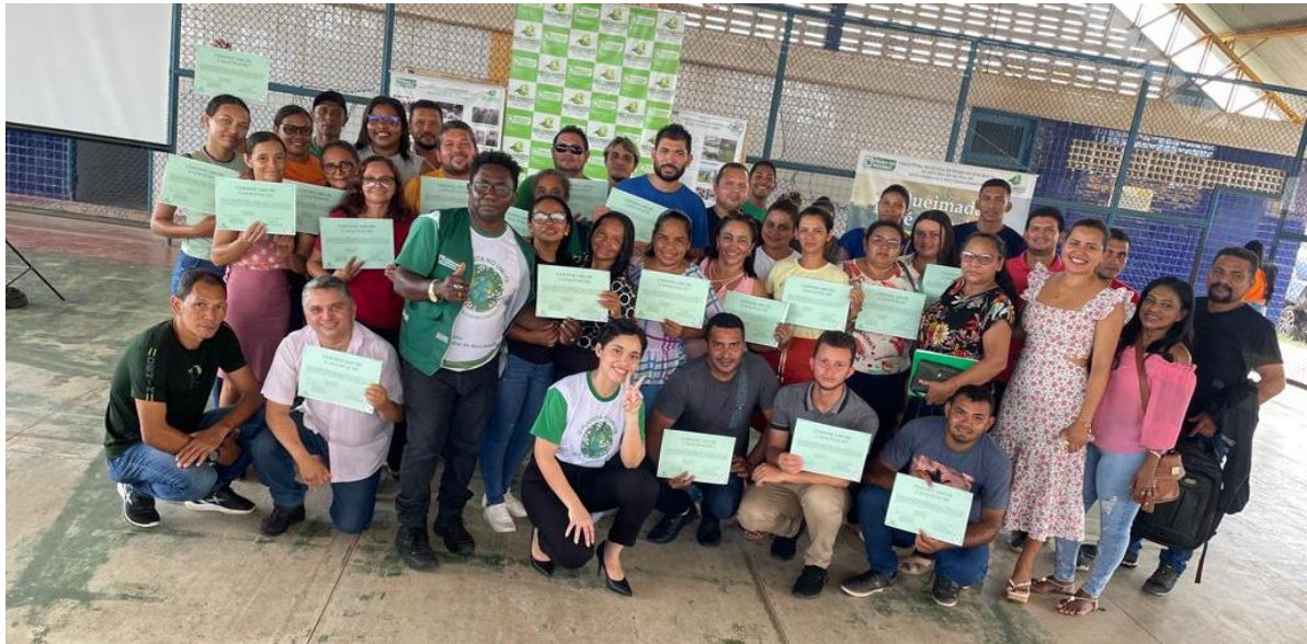
Figura 17: Semana do Meio ambiente