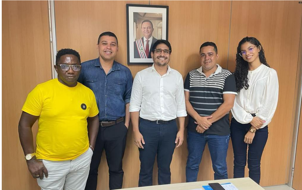
Figura 9: Seminário sobre a Bacia Hidrográfica do Pericumã, realizado pela Companhia de Saneamento Ambiental do Maranhão – CAEMA