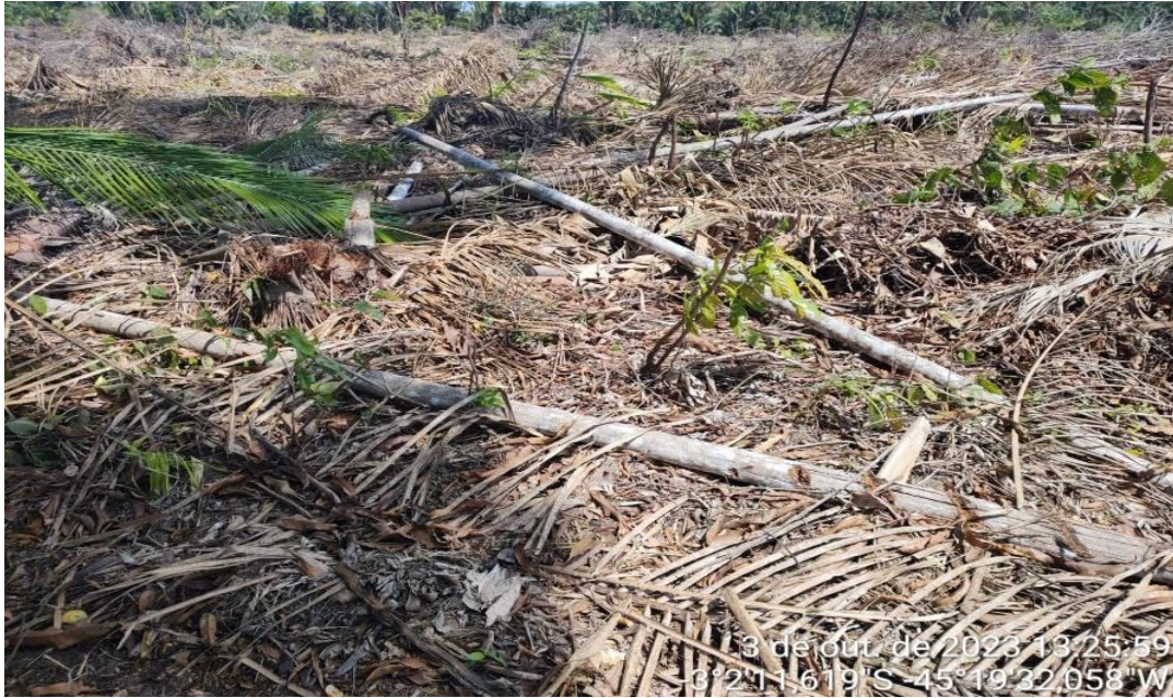
Figura 3: Combate ao Desmatamento em área próxima ao rio no Povoado Pai Inácio