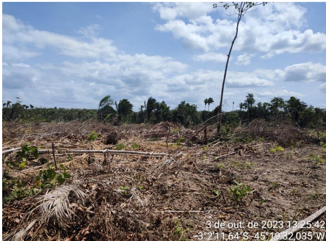
Figura 1: Combate ao Desmatamento no Povoado Cajual