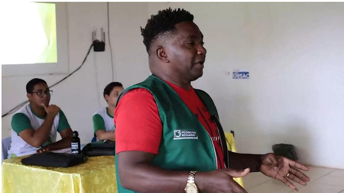
Figura 15: Audiência pública para Discussão sobre Poluição Sonora