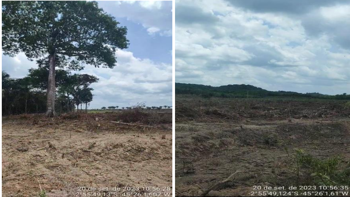
Figura 5: Fiscalização e Combate a Queimadas no Bairro Portelinha em Pedro do Rosário