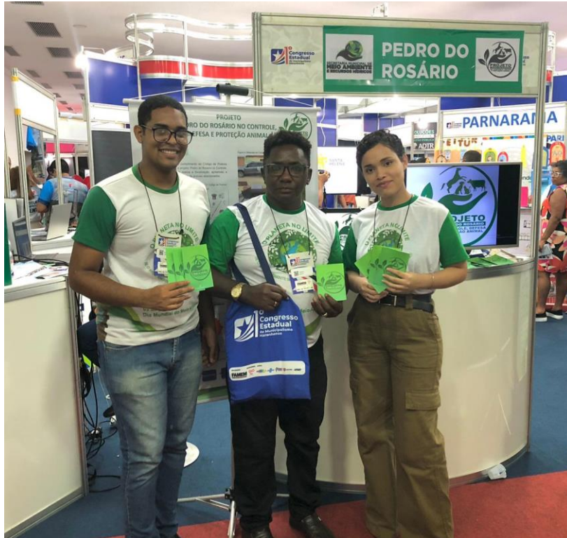
Figura 13: I Fórum de Secretários Municipais de Meio Ambiente do Maranhão realizado em São Luís – Ma